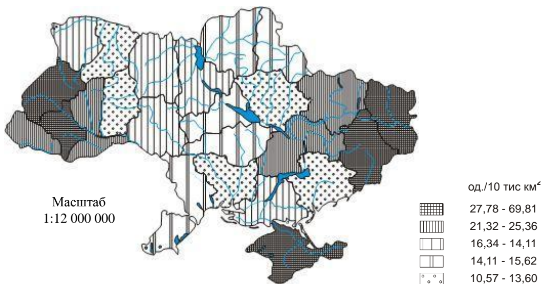
Рисунок 1 Щільність ойконімів за площею території одиниць адміністративно-територіального поділу України

детальна класифікація назв міських поселень за семантичною ознакою, тобто за сенсом, смислом топоніму.