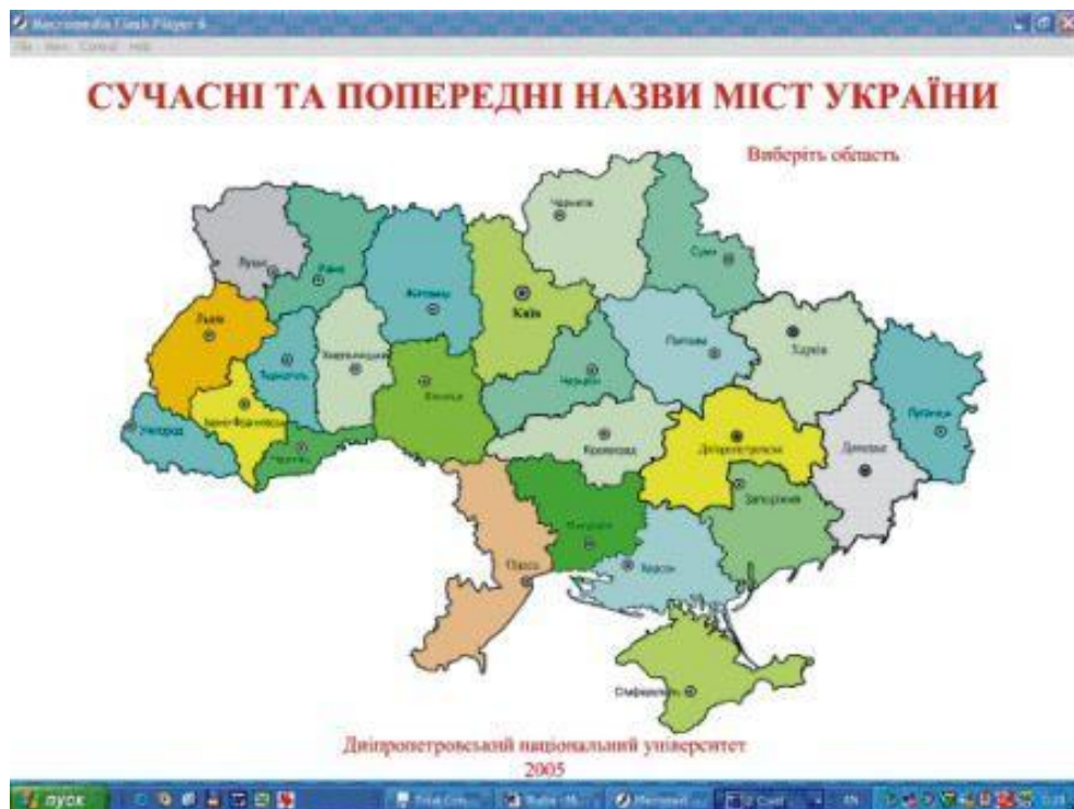
Рисунок 3 Перше діалогове вікно топонімичної інформаційно-пошукової системи «Сучасні та попередні назви міст України»

Система «Сучасні та попередні назви міст України» створена за допомогою продукту Macromedia FLASH MX, version 6.0. Робочий файл може бути представлений у вигляді EXE-файла або HTML-файла. Після запуску програми на екран виводиться карта-схема областей України. При підведенні курсору до будь-якої області, на ній з'являється назва цієї області (рис. 3 2).