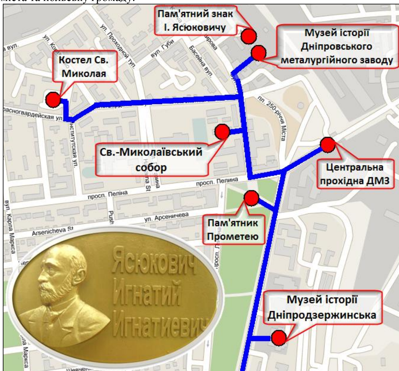
Рис. 2 Картосхема лінії туристичного маршруту «Польська спадщина міста Дніпродзержинська» або «Слідами Ігнатія Ясюковича» територією м. Дніпродзержинська

Ясюковича» , що прокладений вулицями сучасного м. Дніпродзержинська та приміськими шляхами між колишніми Катеринославом та Кам'янським (рис. 2). Обрання м. Дніпродзержинська в якості основного для туристського маршруту зумовлене передусім значною концентрацією пам'яток польської культурної спадщини саме у цьому місті. Основна тема екскурсії – історія та сьогодення Кам'янського – Дніпродзержинська, його визначні місця, пов'язані із «польським слідом» в історії формування промисловості регіону, роль видатного громадянина міста польського походження – Ігнатія Ясюковича – у розвитку металургійної галузі міста та регіону в цілому. Мета екскурсії – ознайомлення туристів з основними історико-культурними пам'ятками Кам'янського – Дніпродзержинська, які дають цілісне уявлення про специфіку міста та польську громаду.