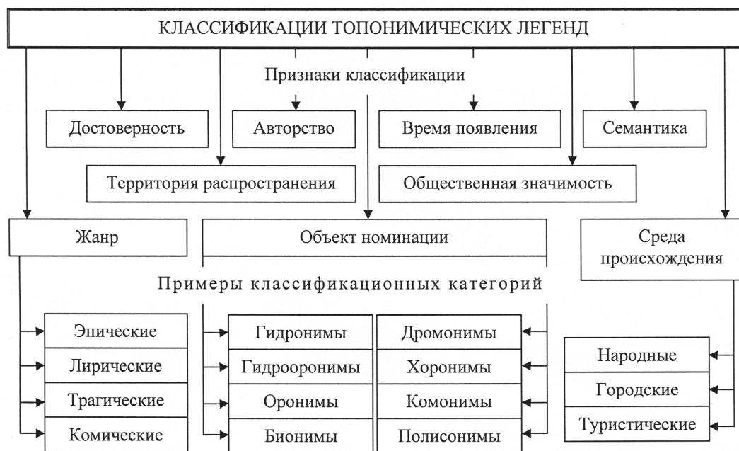
Рис. 1. Модель комплексной классификации топонимических легенд региона

Выявление и учёт топонимических легенд требует их детальной систематизации и классификации. Сегодня разработаны подходы к классификации топонимов и легенд, связанных с ними [8; 10; 12; 16; 20; 22–25]: по объекту номинации, по семантике, по территории распространения, по жанру и стилю изложения, по времени возникновения, по среде происхождения, авторству, по общественной значимости, достоверности и т. д. Но не всегда эти подходы можно успешно применять для классификации именно топонимических легенд на примере конкретного региона. На основе изученных подходов нами разработана собственная модель классификации именно топонимических легенд (рис. 1).